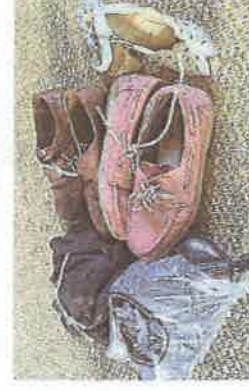
Les chaussures à déposer seront ficelées ensemble, ou attachées par paire par leurs lacets ou dans des sacs en plastique...

Pour cela, une collecte de chaussures qui ne sont plus portées est organisée auprès de la population. Elles sont ensuite rachetées par le Relais Atlantique, entreprise de réin-