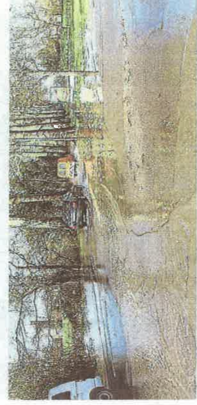
L'entrée de la ville par la route de Nantes a été submergée.