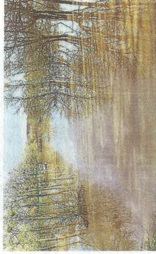
À Saint-Même, le Tenu s'est largement étalé sur l'aire de loisirs et dans les prés.

Le niveau du Falleron était plus élevé que celui du canal d'aménée. La pompe du vannage de Machecoul a pu atténuer la montée du Falleron à raison de 1 000 m 3 /heure. Le boulevard de Grandmaison a été inondé, entre autres raisons, parce que les clapets anti-retour du réseau pluvial se sont retrouvés sous le niveau du Falleron.